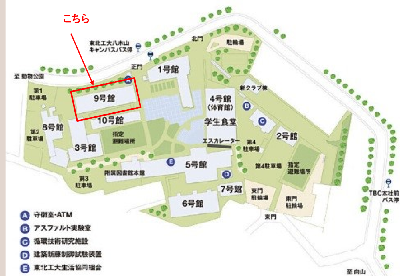
八木山キャンパスマップ

http://www.tohtech.ac.jp/access/index.html